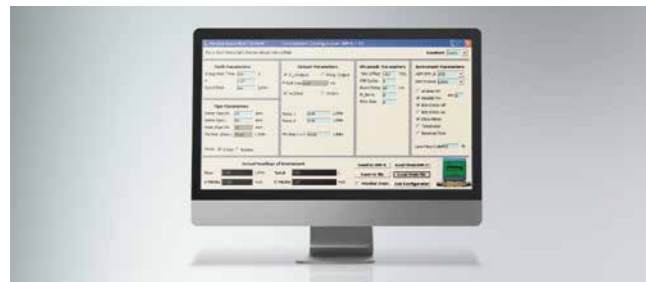
Konfigurationssoftware (optional) Configuration software (optional)